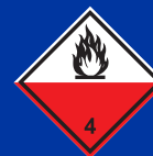
Öngyulladásra hajlamos anyagok