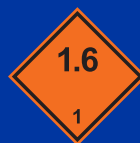
1.6 osztályába tartozó robbanás veszélyes anyag vagy tárgy