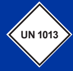
Mentességgel szállítható gázok