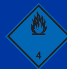
Vízzel érintkezve gyúlékony gázokat fejlesztő anyagok