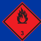
Gyúlékony folyékony anyagok