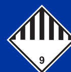
Egyéb veszélyes anyagok és tárgyak