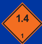
1.4 osztályába tartozó robbanás veszélyes anyag vagy tárgy