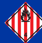
Gyúlékony szilárd anyagok, polimerizálódó anyagok