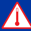
Magas hőmérsékletű anyag