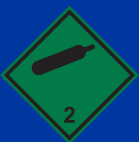
Nem gyúlékony nem mérgező gázok