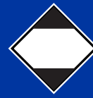
Veszélyes áru korlátozott mennyiségben