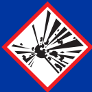
Robbanóanyagok és -tárgyak