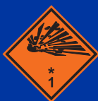
1 osztályába tartozó robbanás veszélyes anyag vagy tárgy

(Ha csak ezek a jelzések vannak önmagukban a csomagon)